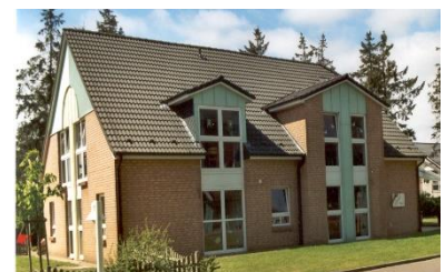
Spielhaus / Vorschule

Wir bieten Ihnen an, am ersten Tag, dem sogenannten Schnuppertag, Ihr Kind zeitweise in die Gruppe zu begleiten.