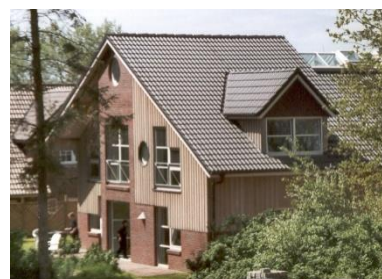
Haus Junge Lüüd

Aus Gründen der Hygiene bitten wir Sie, Ihrem Kind/Ihren Kindern in unserem Haus Hausschuhe, Socken o.ä. mitzugeben.